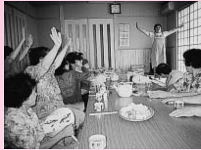
お年寄りたちと楽しく会食

この地方の方言で「いきやり」という言葉があります。人が集まってくつろいだ時間を過ごしたときに「いきやりだった」という言葉が交わされます。