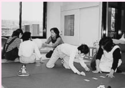
機能回復を目指して

といわれている黄色い花をつけるつきみ草、北麓の地で利用者の健やかな幸せを願って施設の名称を「つきみ草」としました。県内には障害の重い人たちの通園施設は少なく、富士北麓地域のふじざくら養護学校等に通