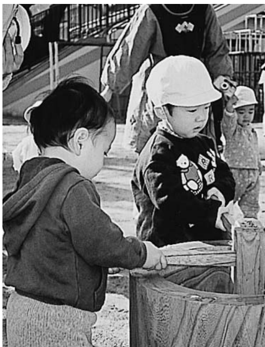
楽しくもちつき交流

平成十年に絵本とおもちゃ図書館、チャイルドセンターとして認可され、障害をもつ親子の場としても活用され、子どもたちがおもちゃも自由に使用し楽しい時間を過ごして