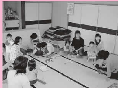
子育てサロンの様子

毎月第3火曜日、塩山市大 藤地区公民館に、生まれたば かりのかわいらしい赤ちゃん や就学前の元気な子供たちが 集まっています。今日は子育 てサロン「お母さんとチビッ