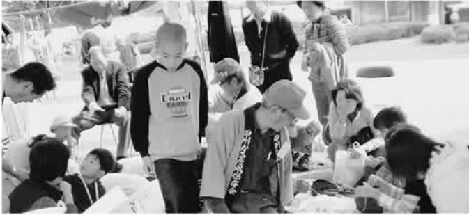
やまなしボランティアフェスティバルでの一コマ

わが国の社会状況は、かつての伝統的な地域の相互扶助機能が弱体化し、地域住民相互の社会的つながりも希薄化しています。高齢化社会の到来、成長型社会の終焉、産業の空洞化、景気の低迷など社会環境がめまぐるしく変化する中で、出生率の低下、自殺やホームレスの急増、家庭内暴力、凶悪な殺人事件、犯罪の低年齢化など新たな問題が深刻化しています。こうした中、地域で安心して生活できる社会の実現に向けた取り組みが、市町村や市町村社協を中心に進められています。今月号では「地域福祉活動計画」について紹介します。