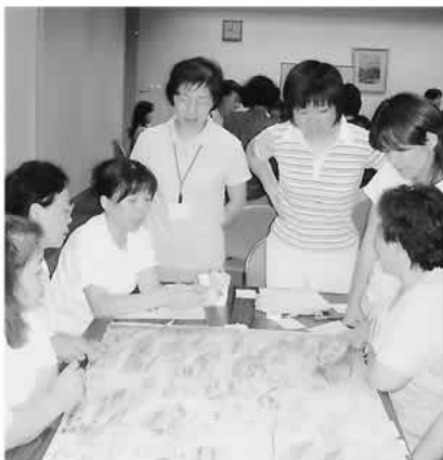
計画策定に向けた話し合い