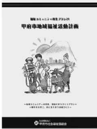
甲府市地域福祉活動計画

今後は評価委員会を立ち上げ、Plan（計画）→Do（実践）→See（評価）の方向ですすめていきます。