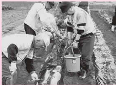
植え付け作業をする園芸菜園部会員

建設され、今でも詩吟、手芸部会の拠点となっています。 園芸菜園部会では畑を借りてジャガイモやサツマイモを栽培。漬物部会では梅の漬け込みを行っています。収穫には部会のメンバーだけで