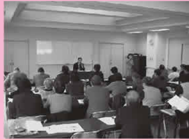
市内の団体が情報交換するボランティア連絡会

く、地元の保育園児も招待し一緒に楽しみます。農産物は地元イベント行事や直売所でも販売され、新鮮で安いと評判も上々とのことです。 参加するお年寄りは「地域のみなさんと互いに趣味活動することが楽しみ」とみなさん口を揃えるそうです。 同社協では「部会に参加することで町のいろいろなところで会っても話が弾み、声を掛け合うことができます。参加者の高齢化など課題点もありますが、今後も活動を支援していきたい」と語ります。