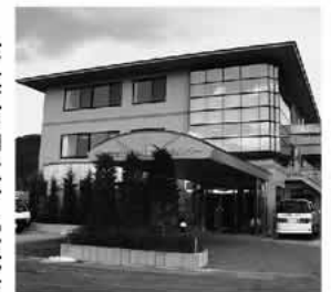
「ひまわり」がある富士吉田市地域福祉交流センター

精神障害者通所授産施設「ひまわり」は、富士吉田地域福祉交流センター内に知的障害者通所授産施設「たんぽぽ」、重症心身障害児(者)通園施設「つきみ草」と共にあります。 四季折々の富士山の絶景を一望できる恵まれた環境のもと、富士吉田市社会福祉協議会が運営しています。 「ひまわり」は郡内唯一の精神障害者授産施設で、現在18人の利用者が市内外から元気に通っています。施設は6年目を迎え、今までに一般企業への就職者が2人おり、作業を通じて社会復帰を支援する施設として、着実に実績を積み上げています。