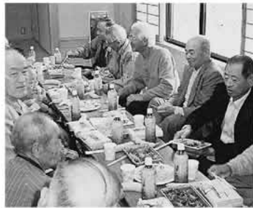
ふれあいサロンのお花見会

同社協は、事務局職員も一人で毎日の仕事に追われ、「活動計画」の策定には取り組めない状況でした。しかし少子高齢化の予想以上の進行と、市町村合併をしない環境のもと、いかに村を存続していくのか、村行政の「長期計画」の見直しが現在行われている中で、住民懇談会が開催されました。