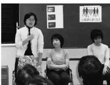
健康セミナーで乳がん検診の受診をPR