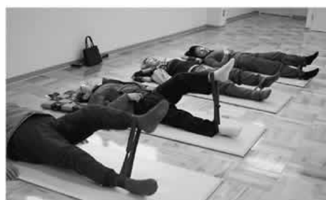
富士河口湖町のゴムを使った筋力トレーニング

教室は週に1回1時間半、大学の先生を招いて参加者の状態に応じた、筋力アップと柔軟性や歩行能力を高める運