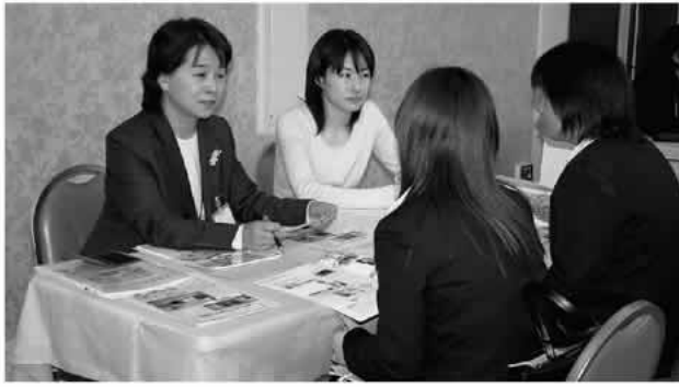
求人者へ相談に臨む学生（合同面接コーナー）

福祉への就労を希望する学生や一般求職者など約230人が参加。中でも、76の求人ブース（社会福祉施設・事業所）が参加した合同面接コー