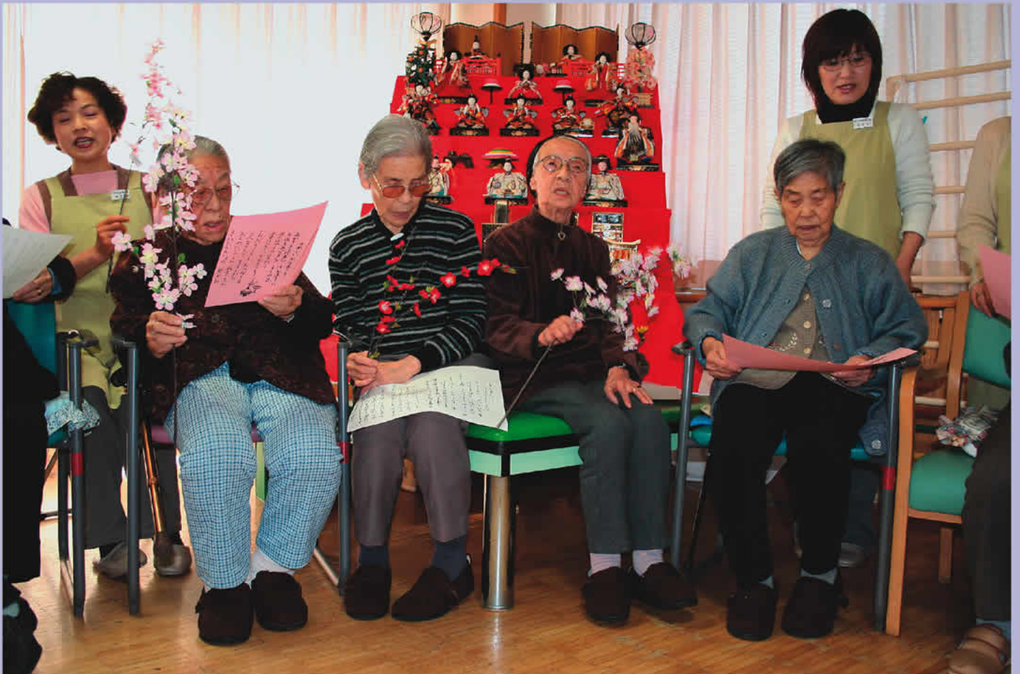
ひな祭りで、昔なつかしい歌を合唱～特別養護老人ホーム奥湯村園～