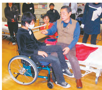
スライディングシート、車いす↓ベッド

できない理由（原因）は千差万別なため、決してすべてを画一的に介護すればよいというものではありません。1人ひとりの顔が違いうように、介護の方法も違いうのです。