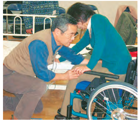
ひざを押ししておしりを座面の奥にいれる