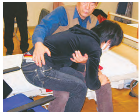
スライディングシートを使った移乗の介護、ベッド→車いす 介護者のひざの上に移乗させた人の脚を乗せ、介護者のおしりを滑らせる