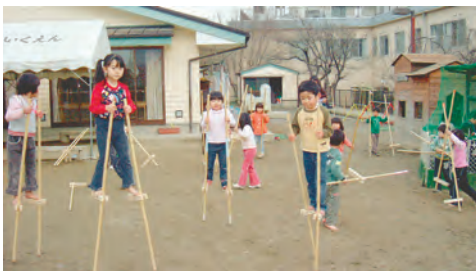
冬でもはだして元気よく遊ぶ

平成13年には、同園は南アルプス市で初めて「地域子育て支援センター」を開設しました。子育て相談をはじめ、親子が遊んだり、交流する場となっています。