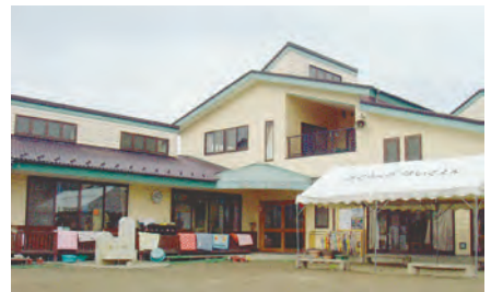
さくらんぼ保育園の外観

「子どもが生まれ、まわってからも働き続けたい」と願う、病院で働くお母さんの思いから、無認可保育所として誕生した「さくらんぼ保育園」。今年で創立40年を迎えます。