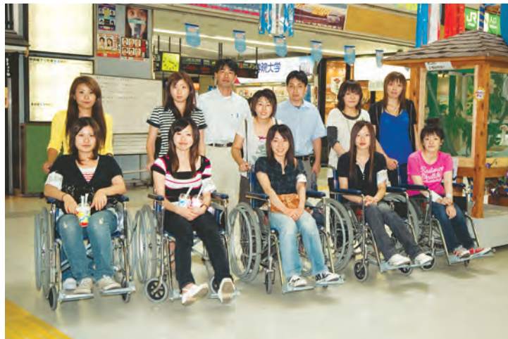
車いすに乗って電車移動の実習