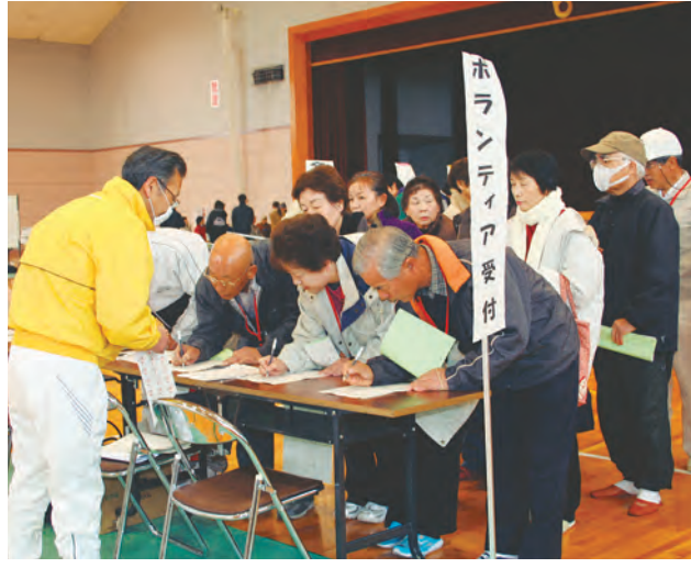
受け付けを済ませ救援活動へ

午後には、ボランティアのセンターに寄せられた活動ニーズに対し、ボランティアを派遣する訓練です。