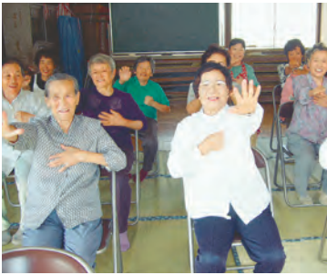
「やってみるじゃん体操」1、2、1、2…

「やってみるじゃん」の今年 のテーマは挑 「やってみる じゃん」の今年 のテーマは挑