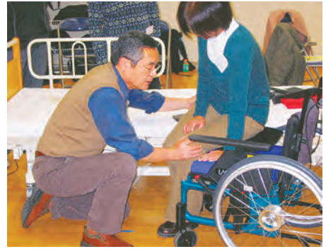
スライディングボードを使ったベッド→車いす移乗