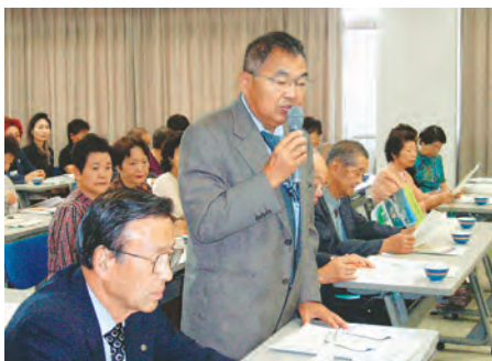
愛知県小牧市への先進地視察