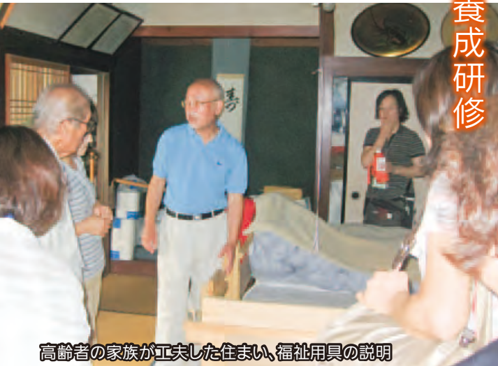
高齢者の家族が工夫した住まい、福祉用具の説明