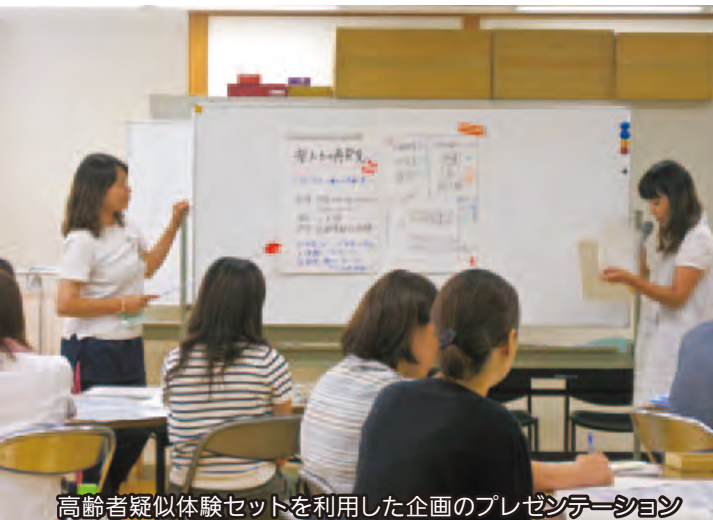
高齢者疑似体験セットを利用した企画のプレゼンテーション