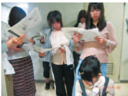
介護課程の学生と授業風景