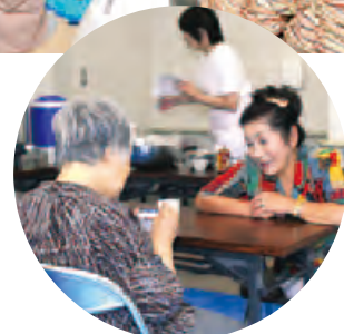
富士吉田市 「ふじよしだささえ愛 ボランティア」の様子