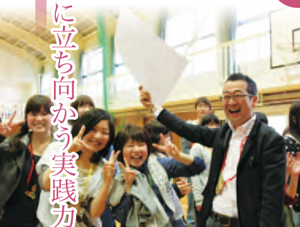
新入生のフレッシュマンセミナー