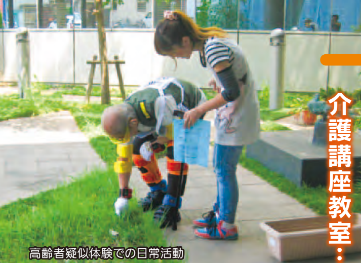
高齢者疑似体験での日常活動