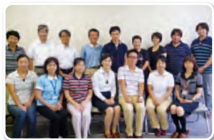
山梨県介護支援専門員協会 理事

平成12年に介護保険制度が施行されて12年が経過しようとしています。しかし、制度の普及が先行してしまい、サービスがいくら存在し充実しても、利用者・ご家族の真に必要なサービスが提供されている、あるいは利用できていないとは限りません。