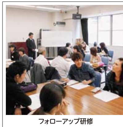
フォローアップ研修

辞めてしまうのではなく「別の施設はどうだろうか」という考えにもつながります。人事異動になっても、知っていることで行きやすいということもあります。