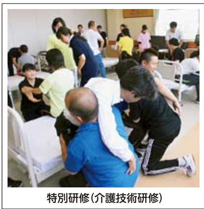
特別研修(介護技術研修)

特別研修は全職員が対象です。移動時間などの効率性も考え、職員数の多い3つの施設で同じ内容を年3回開催し、全職員が参加できる工夫をしています。