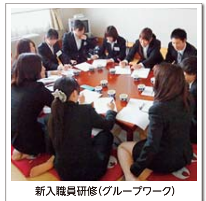
新入職員研修(グループワーク)

県内7カ所ある法人が運営する福祉施設を一日かけて見学もします。現場に入ってしまうとなかなか他の福祉施設に行く機会がないことから実施しています。職員として法人を知ることに加え、「今の職場が合わない」と思うような場合も、すぐに