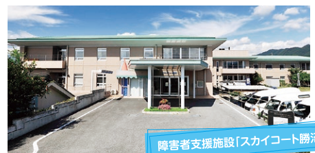
障害者支援施設「スカイコート勝沼」

障害福祉サービス事業所「スカイコート大月」、放課後等デイサービス事業「さくら」(重症心身障碍児)、放課後等デイサービス事業「てならい」、峡東圏域地域生活拠点相談支援事業認可事業所「くるま座」、地域密着型特別老人ホーム「サンコート大月/サンコート大月サテライト」、峡東圏域地域生活支援拠点事業「ワークコート大和」、グループホーム「山公荘」、デイサービス「サンコート山梨」