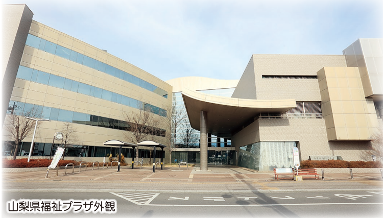
山梨県福祉プラザ外観

「福祉の仕事を目指すあなた」と「福祉の職場」をつなぐ福祉人材無料職業紹介所として、福祉・介護の仕事を目指す方に、無料で福祉・介護の仕事に関する相談、求人情報の提供、就職のあっせんなどを行っています。