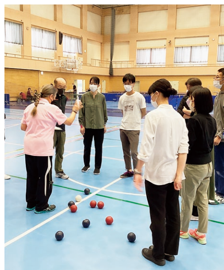
令和5年度「交流の場づくり ~ゆるゆるミーティング~」の様子