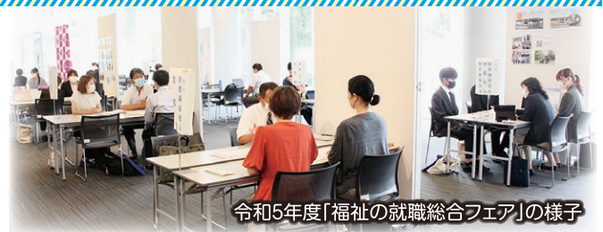
令和5年度「福祉の就職総合フェア」の様子

学生・一般を問わず、福祉・介護のお仕事に興味をお持ちの方ならどなたでも参加OKです。8月2日(金)には山梨県立図書館で「福祉の就職総合フェア in やまなし」を開催予定です!地域別就職相談会は、地域に出向いての開催も予定しています。ぜひご利用ください。